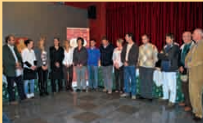
Sapori del Carso dopo la kermesse di serate, degustazioni, mostre ed eventi vari tra Trieste e Gorizia (oltre 20) si sono fermati per la prima volta anche a Prosecco nel rinnovato Kulturndom. Una vera e propria «festa» con il pane, l'olio, il gelato, il vino e le altre bontà dei ristoratori e produttori locali. Per i menù e prodotti ancora disponibili nei 39 esercizi partecipanti vedi: www.triesteturismo.net .

Anche qui da sottolineare l'importante ruolo di collegamento e coordinamento per la parte italiana della nostra associazione, a fianco del Lead partner sloveno Rod Ajdovščina. L'URES è anche uno dei principali fautori del collegamento tra imprese slovene e italiane nell'ambito del piano di promozione 2010 della JAPTI - agenzia dello stato sloveno per la promozione degli investimenti esteri (l'ICE sloveno). Il segno tangibile di questo impegno è il manuale "Operare in Italia", dedicato alle aziende slovene interessate al mercato italiano e frutto del comune lavoro degli esperti SERVIS e URES.